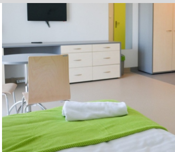
NOCLEGI OLIMPIJCZYK „A”